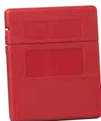
23303 - Middelgrote opening bovenaan