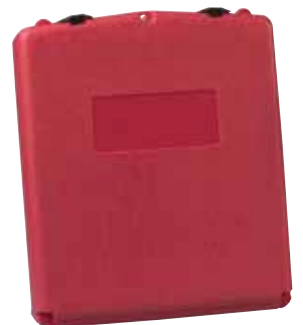
23306 - Grote opening aan de voorzijde