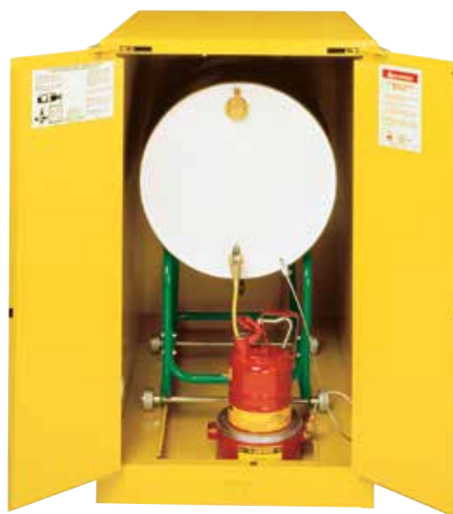
899320 shown with optional 08800 cradle