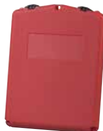
23304 - Middelgrote opening aan de voorzijde