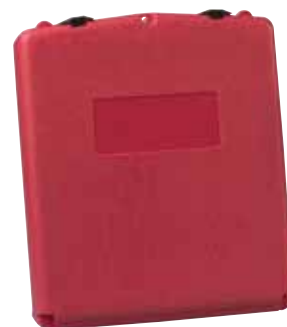
23306 - Grande, ouverture frontale